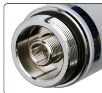
FME male connector