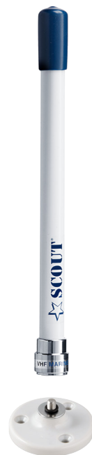
Fast whip removing